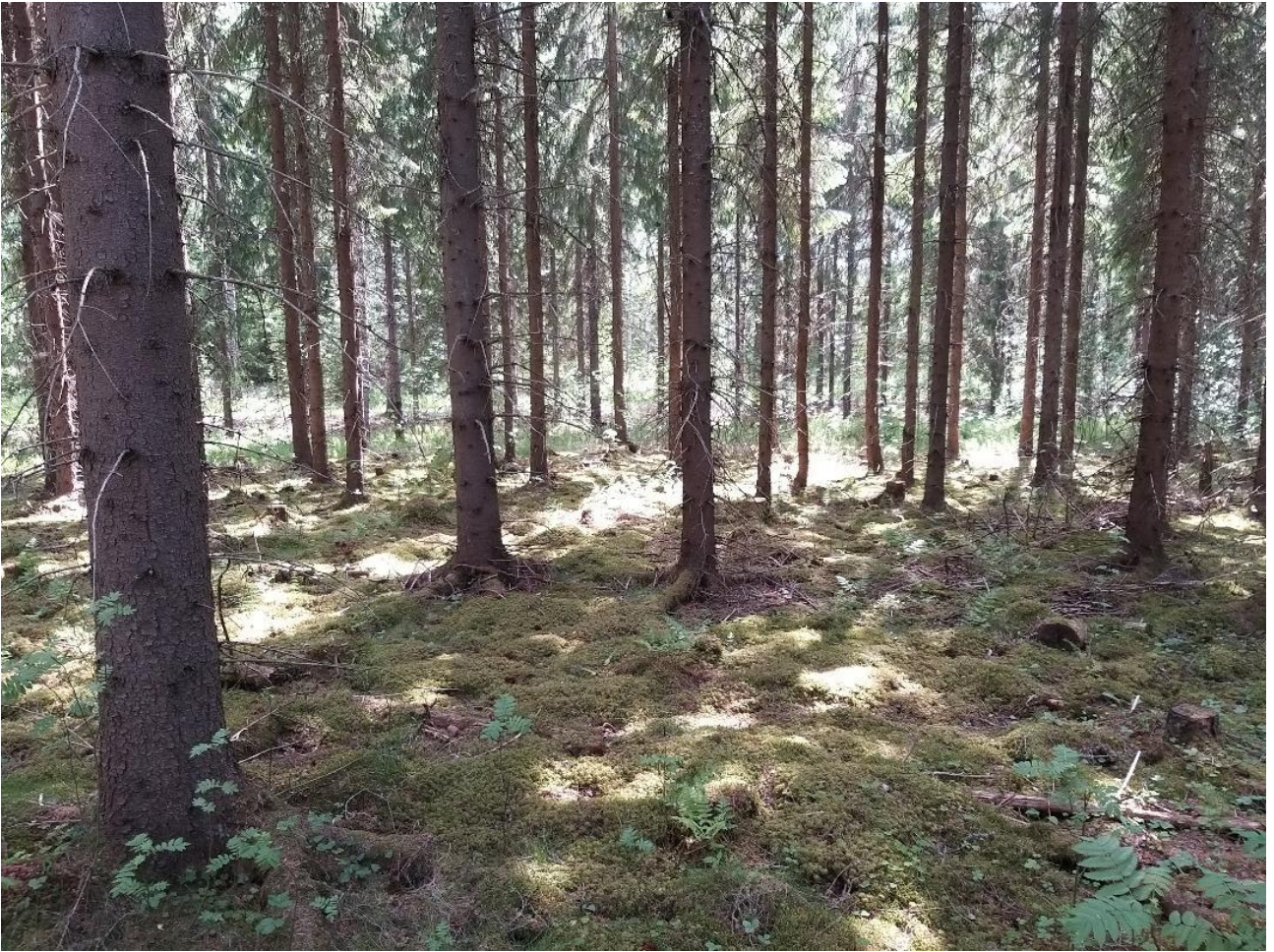
Kuva 1. Kaustaran pohjoispuolista kuusikkoa 12.6.2020. Metsätyypiltään kuusikko on kehittyvää mustikkatyyppiä (MT). Luontotyyppiä tämän ikäisestä kuusikosta on vielä vaikea arvioida.

Alueen pohjoispuolella olevaa mäntyvaltaista sekametsä aukkoa ei arvioitu kasvillisuudeltaan.