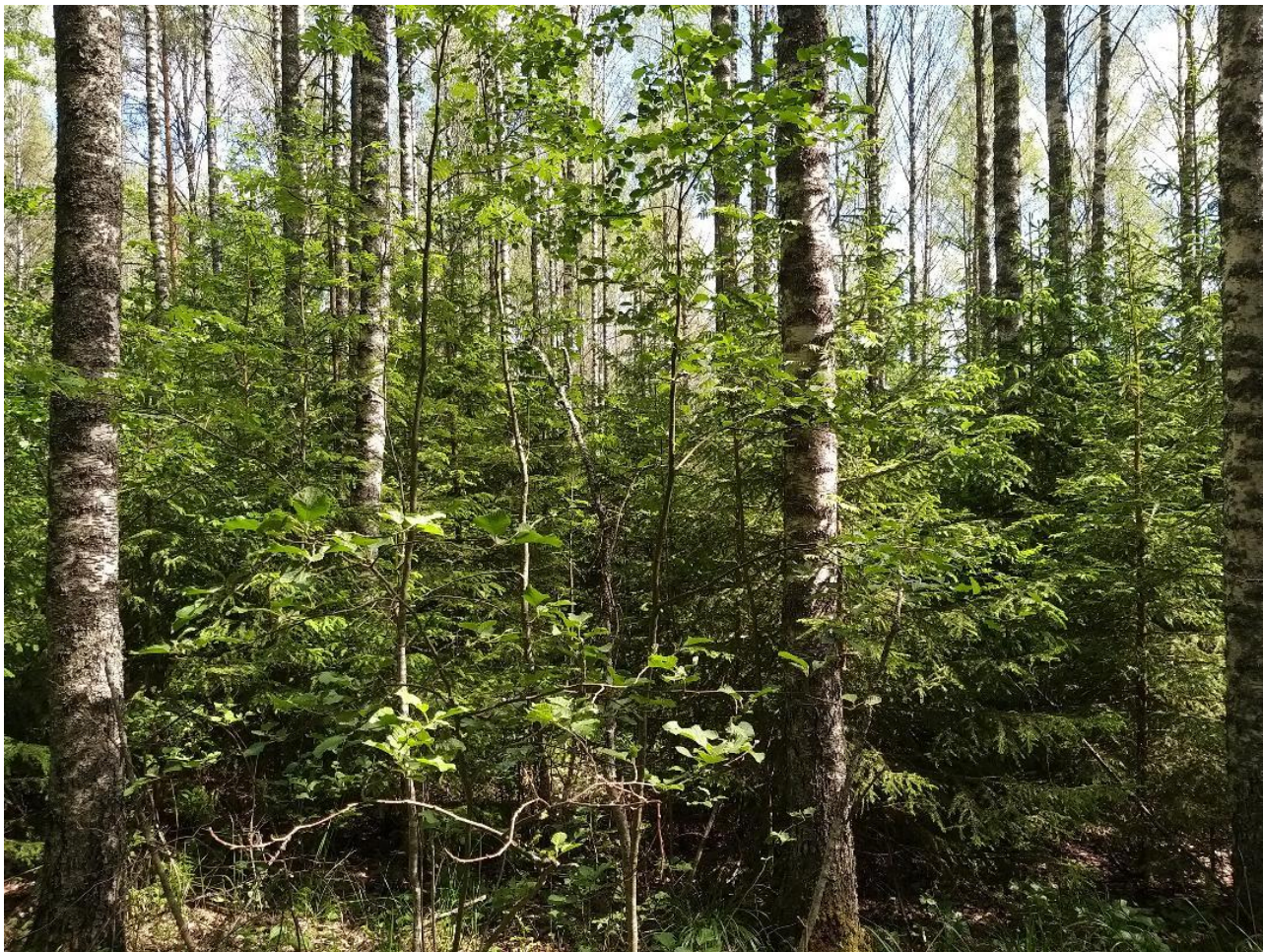
Kuva 2. Uuden lomarakennuksen ( 70m 2 ) sijaintikohdan kasvillisuutta 12.6.2020.

D uusi lomarakennus 70m 2 . Lomarakennuksen sijaintikohdan länsireuna näkyy kuvassa 2. Alue on vanhalle pellon pohjalle istutettua rauduskoivikkoa, jonka ympärysmitta rinnan korkeudelta on n. 88 cm. Alue on pensoittunut lähinnä kuusen varttuvilla taimilla. Pohjakerroksen kasvillisuus käsitti vain paikoitellen seinä- ja metsäkerrossammalen ylisikasvillisuuden takia. Kenttäkerroksessa tavattiin mm. kiolo, koiranputki, käenkaali, lillukka, metsäkorte, metsäkurjenpolvi, metsämansikka, ja nurmitädyke, sekä pensaskerroksessa kuusen lisäksi harmaaleppä, kotipihlaja ja taikinanmarja. Tälläkään kohdalla koivikkoa luontotyyppiä ei kasvillisuuden perusteella voi määrittää.